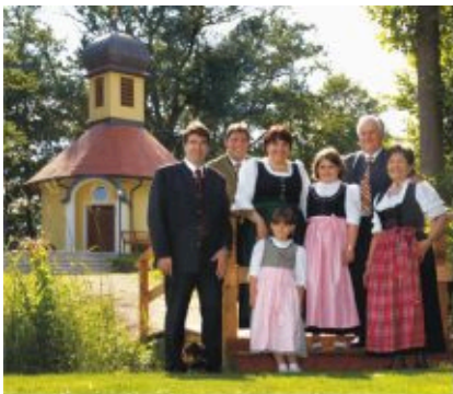
Familie Zettl wünscht allen Gästen und Patienten eine angenehme Erholung.